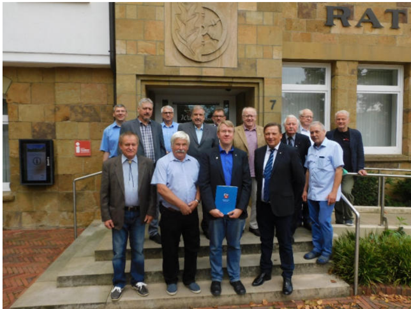
Das Abschlussbild zur Kreisversammlung zeigt alle Teilnehmer vor dem Rathaus der Gemeinde Hagen a.T.W.