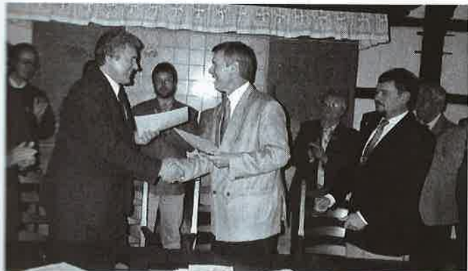
Wie in der großen Politik: Die Bürgermeister beider Orte tauschen die unterzeichneten Verträge bei einem freundschaftlichen Händedruck aus.

trages ist vorgesehen, dass bei gemeinsamen Gottesdienstbesuchen und der Besichtigung öffentlicher Einrichtungen konnten Polen und Deutsche ihrem gemeinsamen Ziel ein Stück näherkommen: einander kennenlernen und private Kontakte zu knüpfen. Web